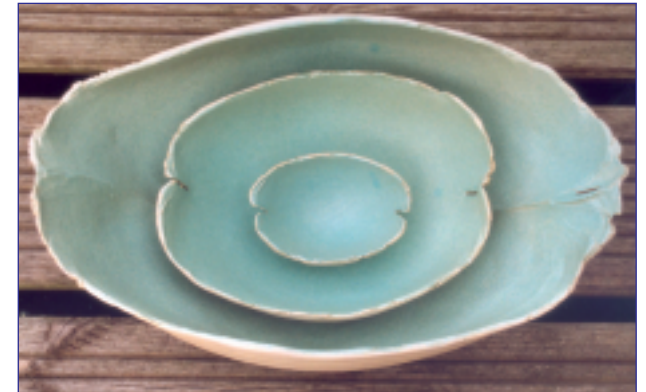
Tineke van de Water