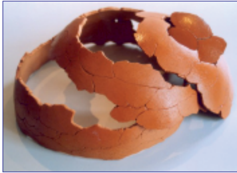
Tineke van de Water