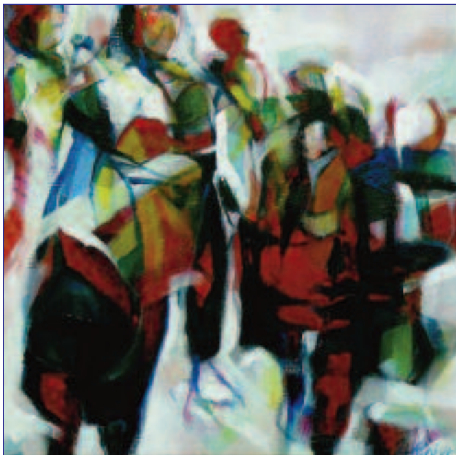
Max de Winter