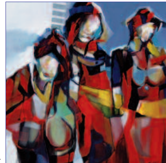
Max de Winter