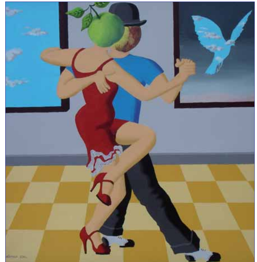
'Tango voor Rene' van Pim Stallmann

DATUM EXPOSITIE 5 oktober t/m 1 december 2006